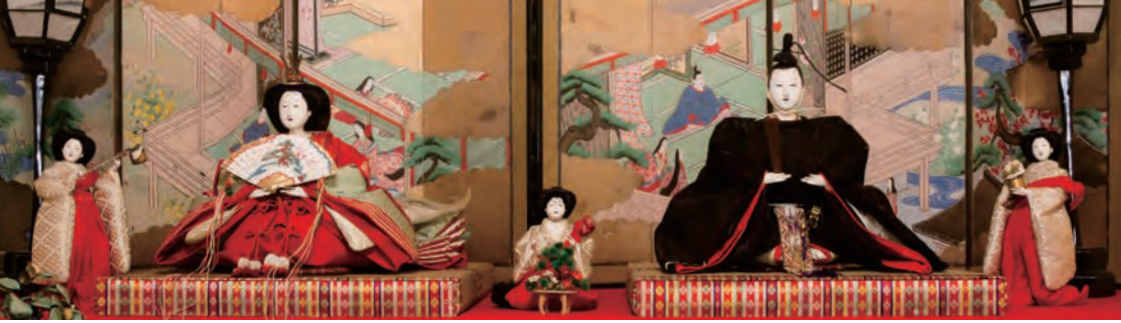
五世大木平蔵製 内裏雛、三人官女