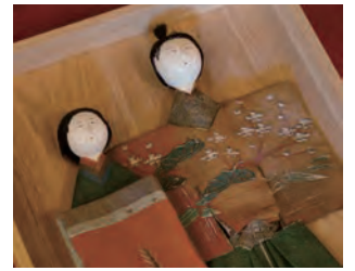
立雛 次郎左衛門頭